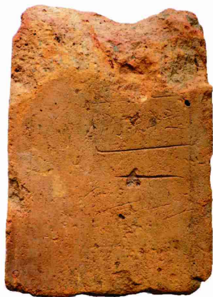
富岡製糸場出土「ヨコスカ造船所」刻印レンガ

平成 24 年、富岡製糸場の敷地から「ヨコスカ造船所」刻印レンガが発掘されたことにより、富岡製糸場と横須賀造船所の繋がりが具体的な「物」の存在によって明らかになりました。この展示会では、富岡製糸場出土の「ヨコスカ造船所」刻印レンガの里帰り展示に焦点をあてた、文化財の繋がりがテーマの特別展示会です。