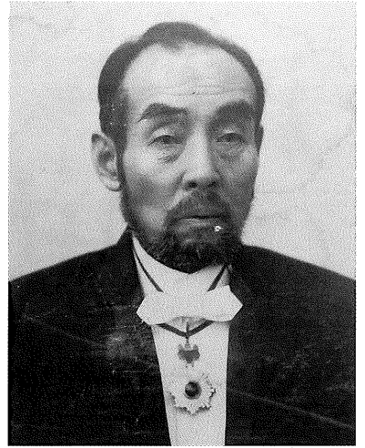
旧藤田組 (現DOWAホールディングス株式会社) 創業者 藤田 伝三郎

本大会では、企業と自治体等の共創という関係を再確認し、将来の展望を探っていきます。